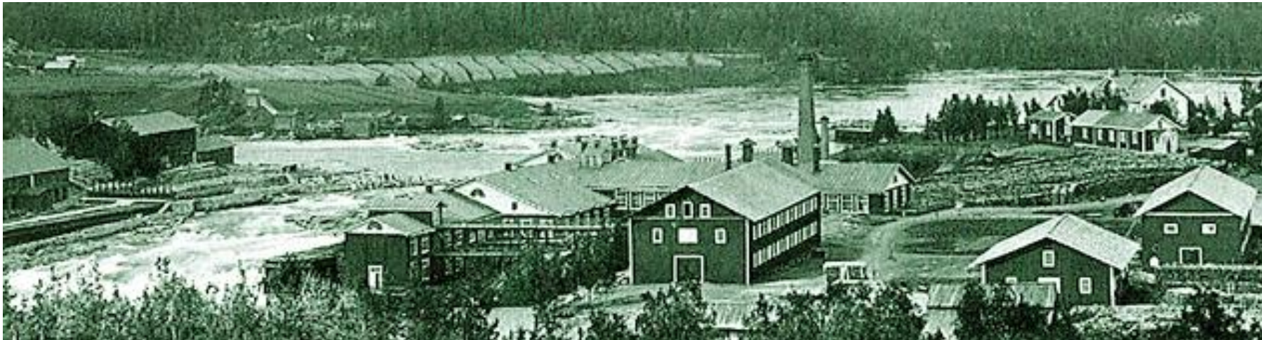
Kuvassa etualalla Kymintehdas v. 1885, taustalla Koskelan rantaa ja Kuusanniemeä.